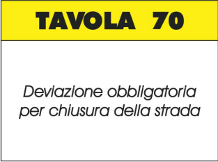
TAVOLA 70 Deviazione obbligatoria per chiusura della strada